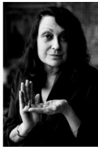
Lina Bo Bardi