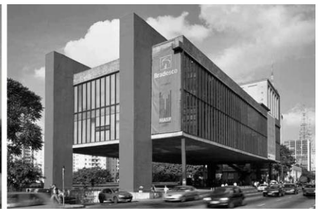
Lina Bo Bardi, MASP, Sao Paulo 1968