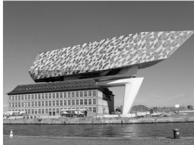
Z. Hadid, Nieuw Havenhuis, Antwerpen 2016